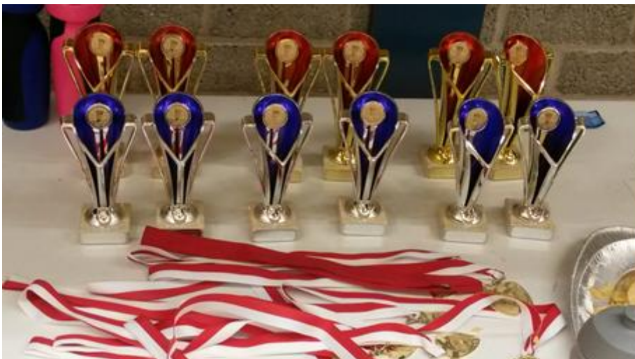
De prijzen die konden worden gewonnen met het Dubbeltoernooi.