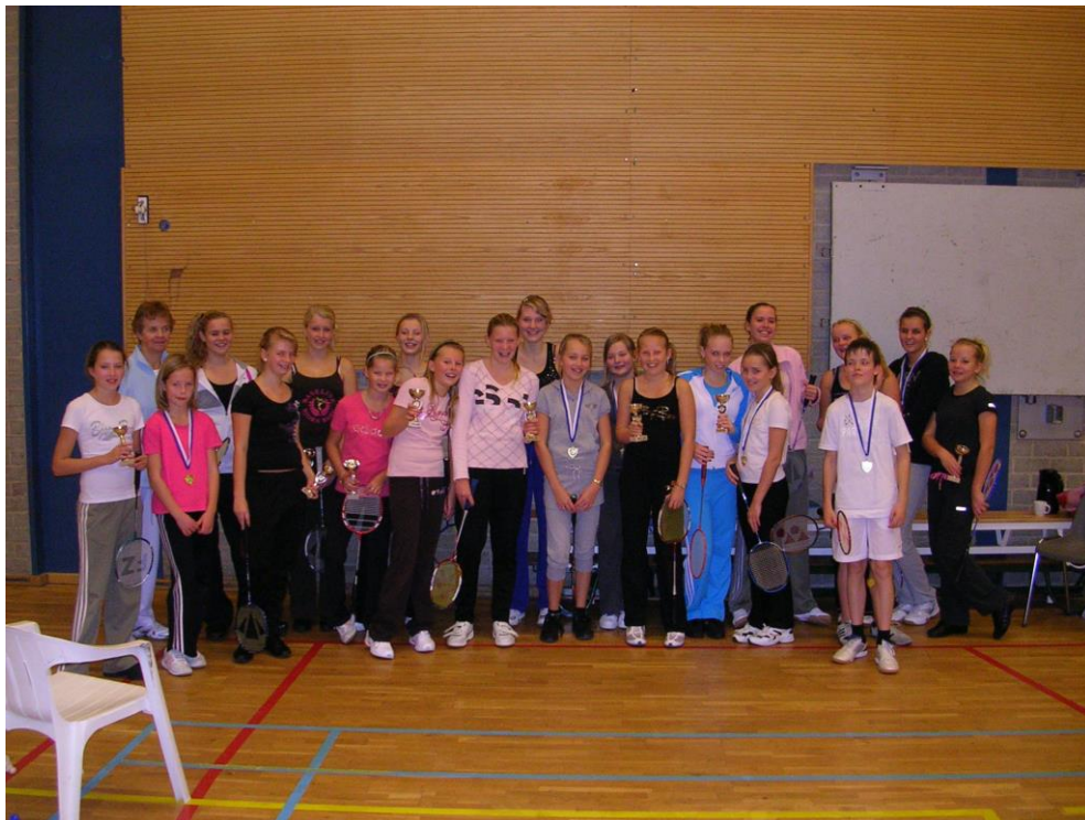
Jeugd Enkeltoernooi 2009